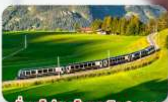
นั้งรถไฟสายโรเมนติก 2 สาย Golden Pass / Luzern Interlaken Express