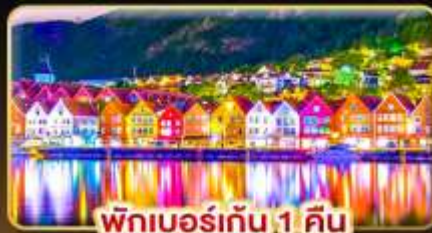
พักเบอร์เกน 1 คืน