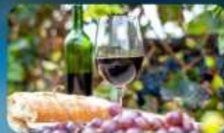
พิเศษ!! ซิมไวน์ท้องถิ่น