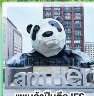
แพนด้าป็นตึก IFS