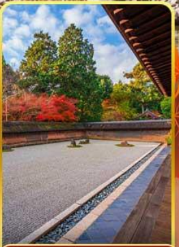
วัดเรียวอันจิ