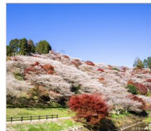
โอบาระ(ซึกิซากุระ)