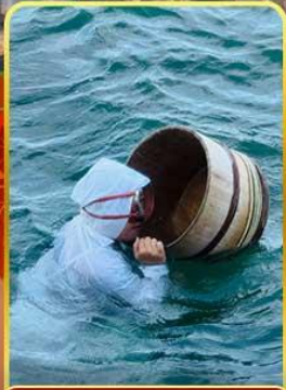
เกาะไข่มุก (โซวามะ)