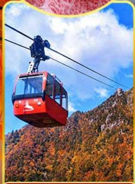
นั่งกระเช้าโกโซโซ