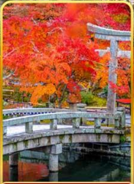
วัดเอทังโง