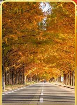
เมตาเซควอยานามิกิ

ออนเซ็น 3 คั้น นน.กระเป๋า 1 ใบ 23 กก. 7Days 5Night