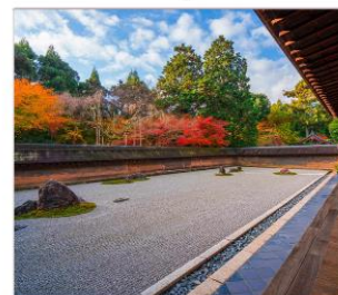
วัดเรียวอันจิ

THAI สายการบินไทย บริการทุกระดับประทับใจ FULL SERVICE