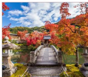
วัดเจอิกังโด