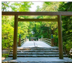
ศาลเจ้าอิเสะ