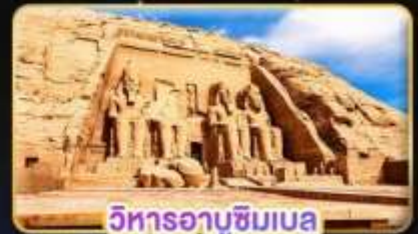
วิหารอบูซิมเบล

น้ำหนักกระเป๋า 23Kg. (ใบระหว่างประเทศ และบินภายใน)