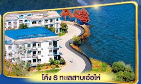
โค้ง S ทะเลสาบเอ่อไห่