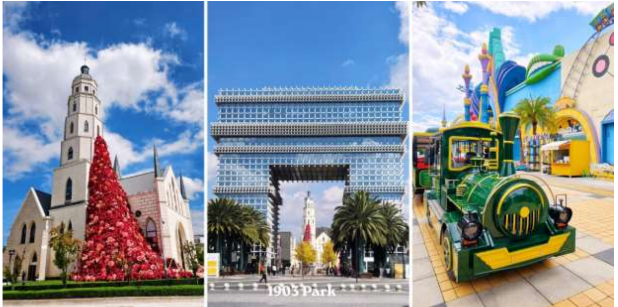
วัดหยวนทง – PARK1903 – สนามบินคุนหมิงฉางชู่ย – กรุงเทพฯสุวรรณภูมิ (อิสระอาหารกลางวัน)

จากนั้นนำท่านสู่ Park 1903 (สวน 1903) แลนด์มาร์คสุดชิค ได้กลิ่นอายยุโรปและศูนย์การค้าไลฟ์สไตล์ใจกลางเมืองคุณหมิง (มณฑลยูนนาน) ที่โดดเด่นด้วยการจำลองสถาปัตยกรรมสไตล์ยุโรป ผสมผสานศิลปะ ความบันเทิง และสวนสนุกเข้าไว้ด้วยกันอย่างลงตัว สถาปัตยกรรมจำลอง ประตูชัยปารีส อันโด่งดังโบสถ์คริสต์ (Gospel Auditorium) และพื้นที่จัดแสดงนิทรรศการPop Mart สาขาใหญ่ สำหรับสายอาร์ตทอยสวนสนุก Dream Park: สวนสนุกที่มีทั้งโซนในร่มและกลางแจ้ง (ตั๋วไม่รวมค่าเข้าสวนสนุก)เป็นแหล่งเสื้อผ้าแบรนด์เนมทั้งของจีนและต่างประเทศ เครื่องประดับอัญมณีชิ้นเยี่ยม ร้านเครื่องดื่ม ร้านอาหารพื้นเมือง