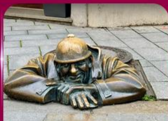
เชลฟ์คูคูมิล บราติสลาวา