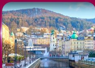
เมืองสปาแสนสวย คาร์โลวี วารี