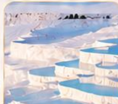
PAMUKKALE ปามุกคาล่า