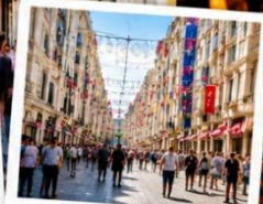
ISTIKLAL STREET (Grand Avenue of Pera) ถนนสายช้อปปิ้ง ยืน 88 ตรกม.ในทีเดียว