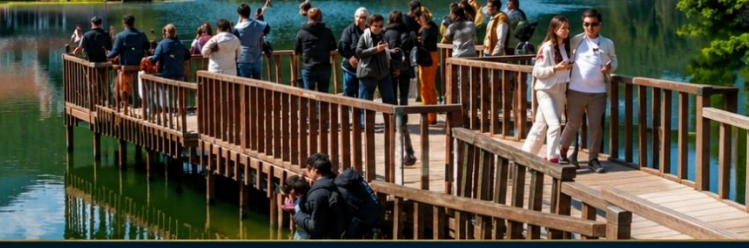
จุดหมายยอดนิยมของนักท่องเที่ยว สำหรับการพักผ่อนและใกล้ชิดธรรมชาติ

ได้เวลาเดินทางต่อ อิสตันบูล เป็นเมืองที่มีความสำคัญที่สุดและเป็นเมืองที่มีประชากรหนาแน่นมากที่สุดในตุรกี เป็นเมืองที่ตั้งอยู่ริมช่องแคบบอสฟอรัส Bosphorus เดิมชื่อว่า คอนสแตนติโนเปิล ซึ่งเป็นอาณาจักรที่ยิ่งใหญ่ในประวัติศาสตร์ เป็นเมืองสำคัญของชนเผ่าจำนวนมากในบริเวณนั้น จึงส่งผลให้อิสตันบูลมีชื่อเรียก