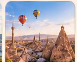
CAPPADOCIA คัปปาโดเกีย