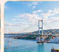
BOSPHORUS STRAIT ช่องแคบบอสฟอรัส