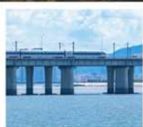
นั่งรถไฟใต้ดินข้ามทะเล