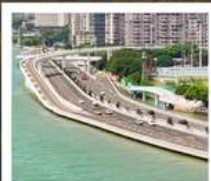
สะพานเหยียนหฺวู่เฉียว