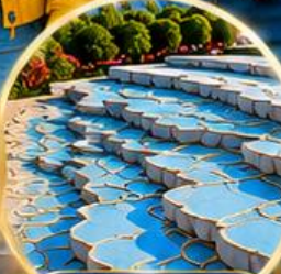
ปานุกคาล์ Pamukkale