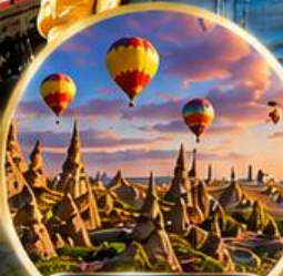
เมืองคปปาโดเกีย Cappadocia