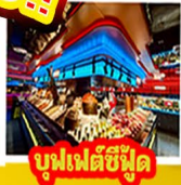
บุฟเฟ่ต์ซีฟู้ด