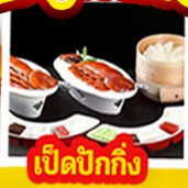
เปิดปิ้งกั๊ง