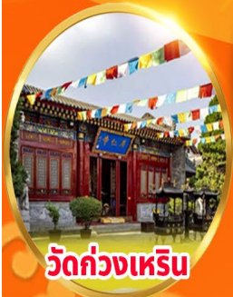
วัดกวางเหริน