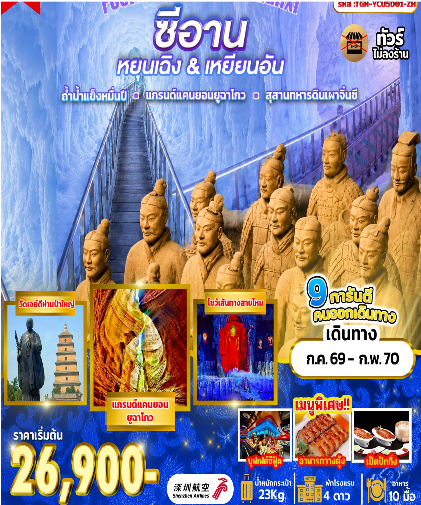
วัดเจย์ดีห่านป่าใหญ่

ถ้ำน้ำแข็งหมื่นปี □ แกรนด์แคนยอนยูลาโก □ สุสานทหารดินเผาจีนซี