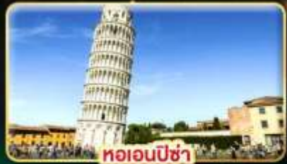
หออนพีซ่า