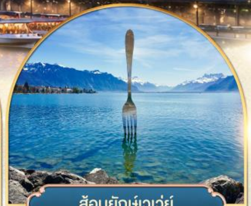
ส้อมยักเขาวัว