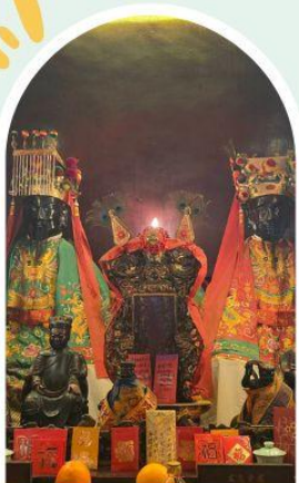
วัดหมิ่นโหมว