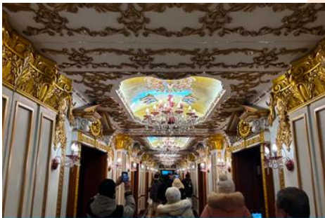
ตึกเภสัชกรรมฮาร์บิน

จากนั้นนำท่านเที่ยวชม ถนนจงยังลู่ 中央大街 ถนนสายหลักของเมืองฮาร์บิน ถนนที่เต็มไปด้วยอาคารบ้านเรือนที่เป็นสถาปัตยกรรมตะวันตกที่สร้างในช่วงคริสต์ศตวรรษที่ 18 – 19 ที่เมืองนี้ถูกปกครองโดยรัสเซีย อีกทั้งเป็นถนนคนเดินที่เป็นแหล่งรวมร้านค้าสินค้าแบรนด์เนมทั้งในและต่างประเทศ ร้านจำหน่ายของที่ระลึกและสินค้าพื้นเมือง ร้านอาหารพื้นเมืองต่าง ๆ มากมาย ให้ท่านมีเวลาอิสระเดินเที่ยวและช้อปปิ้ง หรือลิ้มรสอาหารพื้นเมืองตามอัธยาศัย.. **ให้ท่านลิ้มรสไอศกรีมชื่อดังเก่าแก่ของเมืองฮาร์บินท่านละ 1 ท่านฟรี