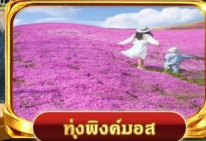
ทุ่งฟิงคัมมอส