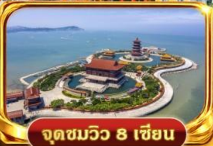
จุดชมวิว 8 เชียง