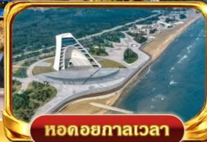
หอดอยกาลเวลา