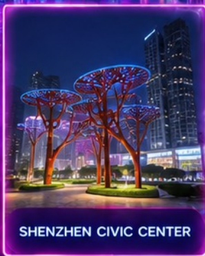
SHENZHEN CIVIC CENTER

ชมสถาปัตยกรรมระดับโลก พิพิธภัณฑ์ศิลปะร่วมสมัยเซินเจิ้น (MOCAPE) และ Shenzhen Civic Center