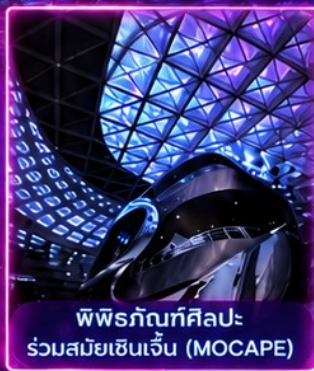
พิพิธภัณฑ์ศิลปะร่วมสมัยเซินเจิ้น (MOCAPE)