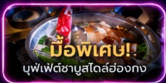
มือพิเศษ! บุฟเฟ่ต์ชาบูสโตสฮ่องกง

UpperHills จุดถ่ายรูปสุดชิบของวัยรุ่นเซินเจิ้น - OCT Loft ย่าน Creative Park - OCT Harbour Happy Coast - Shenzhen Bay Culture Plaza - Cyberpunk พิพิธภัณฑ์ศิลปะร่วมสมัยเซินเจิ้น (MOCAPE) - Joy City Center (One Avenue) - Shenzhen Civic Center - shigu garden - วัดเจ้าแม่กวนอิม - วัดแชกงหมิว