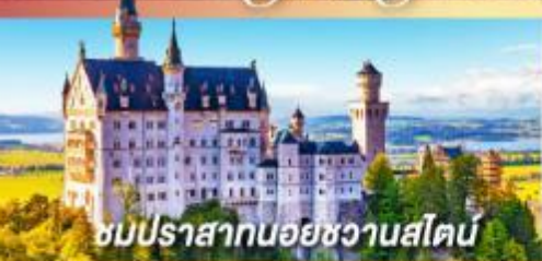
ชมปราสาทนอยชวานสไตน์