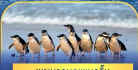
พาเหรดนกเพนกวิน