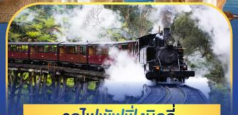
รถไฟพัพฟิงบิลลี่

ล่องเรือชมอ่าวซิดนีย์พร้อมรับประทานอาหารกลางวัน และ เข้าชมสวนสัตว์การองก้า