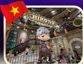
POPMART บานาฮิลล์