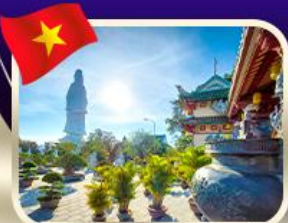
ชมพระกวนอิมวัดหลันอั้ง