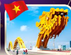
สะพานมังกร ดานัง