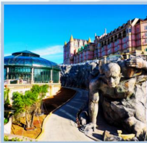
โซน Eclipse Square