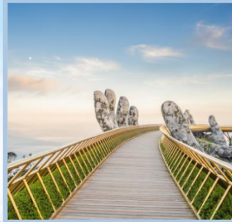
สะพานมือทองคำ