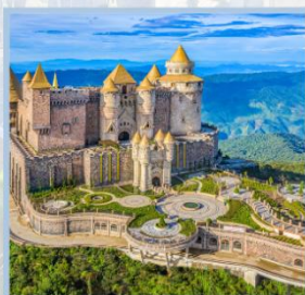
ปราสาทจันตรา