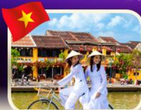
เช็คอินเมืองเก่าฮอยอัน