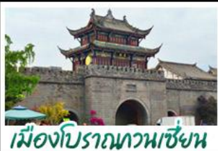
เมืองโบราณทวนเซี่ยน

ภูเขาสี่ดรุณี - อุทยานปี้ผิงโกว - สะพานหนานเฉียว - ร้านหนังสือจงซูเก๋ - เมืองโบราณกวนเสียน จตุรัสเทียนหู่ - หมู่บ้านต้าเซฟี่ - ถนนโบราณชอยกว้างชอยแคบ - ถนนคนเดินไท่กูหลี่ ถนนคนเดินซุนซี - ถนนโบราณจินหฺสึ - พิพิธภัณฑ์ปักกิ่ง - น้ำพุไม้ไผ่ตึกSKP - วัดต้าฉือ