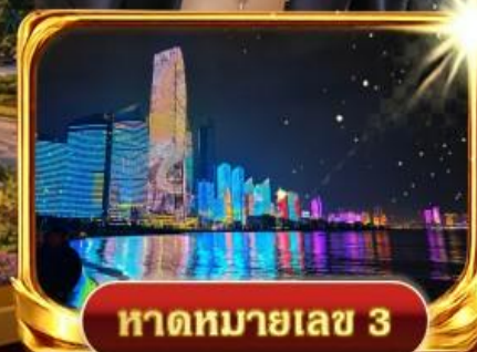
หาดหมายเลข 3