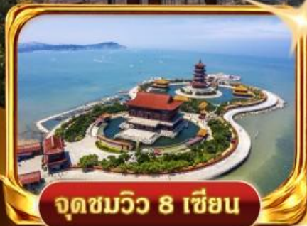
จุดชมวิวกว 8 เซียน