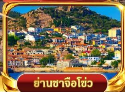
ย่านซาจื่อไฮ่