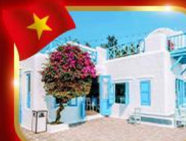
คาเฟ่สุดชิค ซานทรา มารีน่า