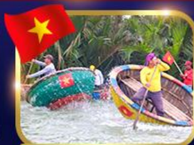
ล่องเรือกระดัง หมู่บ้านกัมกาน