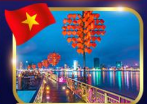
สะพานแห่งความรัก ดานัง