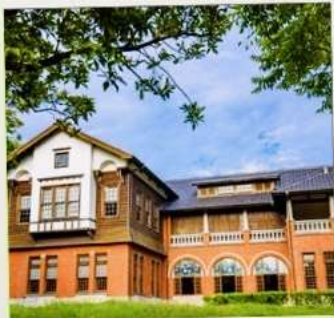
พิพิธภัณฑ์น้ำพุร้อนเป่ย์โถว