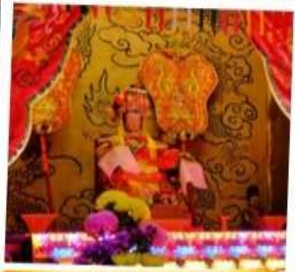
เจ้าแม่ทับทิม จอสเฮ้าส์เบย์