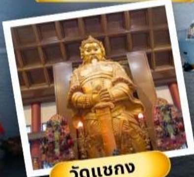
วัดเขากง