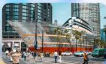
เรือทลยส์วิตคอง