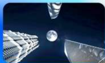
ลู่อิจยส์