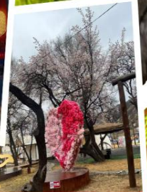
สวนแอปริคอต