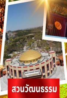
สวนวัฒนธรรม