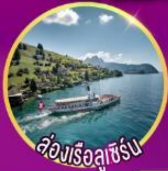
ล่องเรือลูเซิร์น