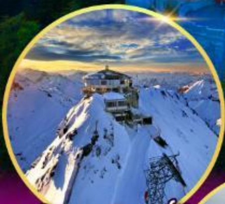
ยอดเขาซิลรอร์น