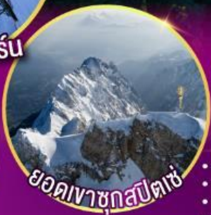
ยอดเขาชุกสปีตเซ