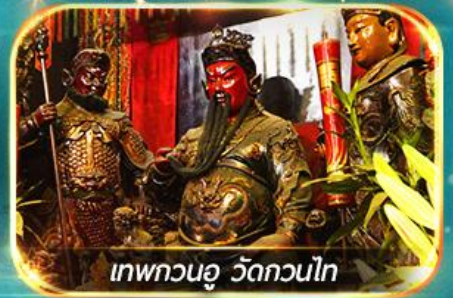
เทพกวนอู วัดกวนไท

พามูไหว้พระ: ขอรพร 8 วัดดัง, อิสระช้อปปิ้ง 1 วันเต็มแบบจุใจ หรือเลือกซื้อ OPTION กระเป๋าหนัง 360 / ดิสนีย์แลนด์