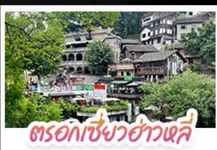
ตรอกเซียวฮ่าวเฉี