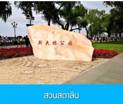
สวนสตาลิน