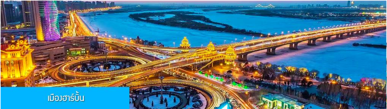
เมืองฮาร์บิน

หลังอาหารนำท่านเดินทางสู่ เมืองฮาร์บิน 哈尔滨市 (ระยะทาง 250 กม. ใช้เวลาเดินทางราว 3 ชั่วโมงเศษ) เมืองฮาร์บินเป็นเมืองที่ตั้งอยู่ทางตอนเหนือของจีนที่มีพรมแดนติดกับประเทศรัสเซีย เป็นเมืองเอกของมณฑลเฮยหลงเจียง มีสมญานามว่าเป็นกรุงมอสโกตะวันออก และได้ชื่อว่าเป็นเมืองหลวงแห่งฤดูหนาวเนื่องจากเมืองแห่งนี้มีช่วงฤดูหนาวยาวกว่าฤดูร้อน มีเทศกาลแกะสลักน้ำแข็งนานาชาติจัดขึ้นที่เมืองนี้ในช่วงฤดูหนาวของทุกปี เป็นจุดหมายปลายทางสำหรับนักท่องเที่ยวทั้งในและต่างประเทศที่ชื่นชอบความสวยงามของหิมะในฤดูหนาว