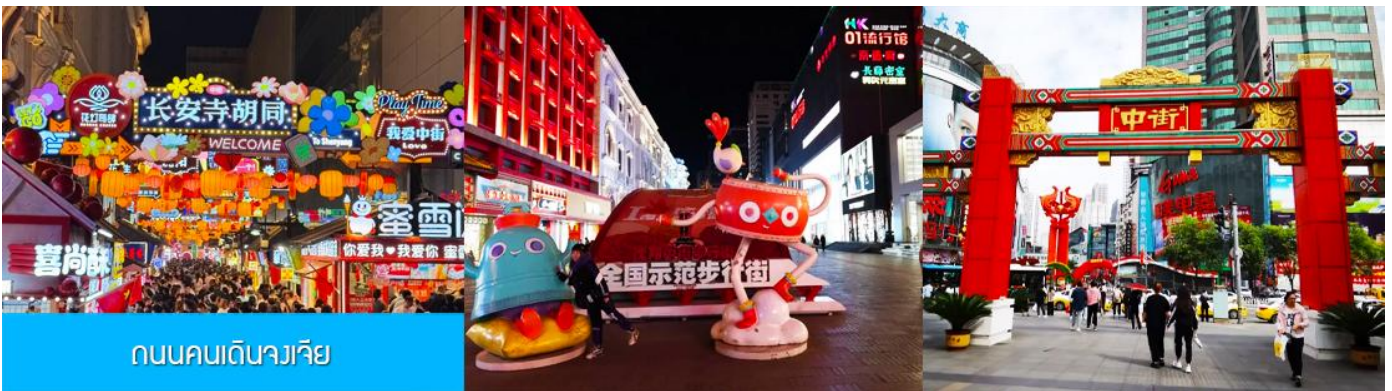
ถนนคนเดินจางเจีย

จากนั้นนำท่านเดินทางสู่ เมืองเสิ่นหยาง 沈阳市