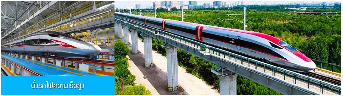
บริการรถไฟความเร็วสูง

14.05 น. นำท่านขึ้นรถไฟความเร็วสูงขบวนที่ G910 (14.05/18.46) เพื่อเดินทางไปยังกรุงปักกิ่ง 18.46 น. ขบวนรถไฟนำท่านเดินทางถึงกรุงปักกิ่ง นำท่านเดินทางโดยรถบัสภัตตาคาร เย็น รับประทานอาหารค่ำ ณ ภัตตาคาร (12) หลังอาหารนำท่านเดินทางสู่ สนามบินต้าชิง กรุงปักกิ่ง ทำการเช็คอิน โหลดสัมภาระก่อนขึ้นเครื่อง