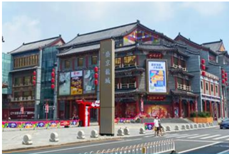
ถนนแมนจูเรีย