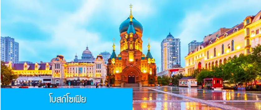
โบสถ์โซเฟีย

รับประทานอาหารเช้า ณ ห้องอาหารของโรงแรม (10)