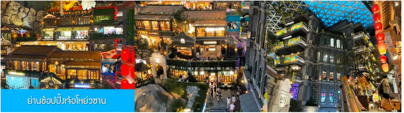
ย่านช้อปปิ้งเจ้อห้วยซาน

นำท่านเที่ยวชม ย่านช้อปปิ้งเจ้อห้วยซาน 这有山 แหล่งช้อปปิ้งจีนชื่อที่ผสมผสานระหว่างสถานที่ท่องเที่ยว และแหล่งรวมร้านค้า และร้านอาหารฟาสต์ฟู้ด อาหารพื้นเมืองร่วมสมัย ภายใต้คอนเซ็ปต์ แหล่งช้อปปิ้งบนภูเขา และบนภูเขามีย่านช้อปปิ้ง เป็นจุดเช็คอินยอดนิยมที่เปิดให้คนพื้นที่และนักท่องเที่ยวเข้าชมตั้งแต่ปี ค.ศ. 2019