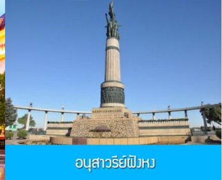
อนุสาวรีย์พิงหว

หลังอาหารนำท่านชม โบสถ์ เซนต์โซเฟีย 索菲亚教堂 (ชมด้านนอก) อีกหนึ่งสัญลักษณ์ที่โดดเด่นของเมืองฮาร์บิ น สร้างขึ้นในปี ค.ศ. 1907 เป็น โบสถ์คริสต์นิกายออร์ทอดอกซ์ ที่ใหญ่ที่สุดในเอเชียตะวันออกเฉียง ที่แสดงถึงอิ พลของวัฒนธรรมรัสเซียที่มีต่อเมืองฮาร์บิน