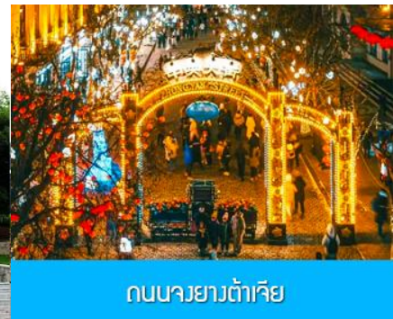
ถนนยาวต้าเจีย