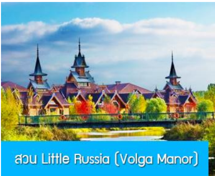
สวน Little Russia (Volga Manor)

หลังอาหารนำท่านเดินทางสู่ เมืองฮาร์บิน 哈尔滨市 (ระยะทาง 250 กม. ใช้เวลาเดินทางราว 3 ชั่วโมงเศษ) เมืองฮาร์บินเป็นเมืองที่ตั้งอยู่ทางตอนเหนือของจีนที่มีพรมแดนติดกับประเทศรัสเซีย เป็นเมืองเอกของมณฑลเฮยหลงเจียง มีสมญานามว่าเป็นกรุงมอสโกตะวันออก และได้ชื่อว่าเป็นเมืองหลวงแห่งฤดูหนาวเนื่องจากเมืองแห่งนี้มีช่วงฤดูหนาวยาวกว่าฤดูร้อน มีเทศกาลแกะสลักน้ำแข็งนานาชาติจัดขึ้นที่เมืองนี้ในช่วงฤดูหนาวของทุกปี เป็นจุดหมายปลายทางสำหรับนักท่องเที่ยวทั้งในและต่างประเทศที่ชื่นชอบความสวยงามของหิมะในฤดูหนาว