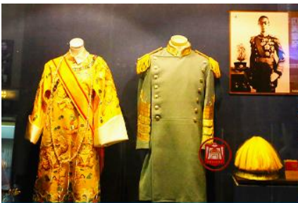
พระราชวังปู้ยี้

เช้า รับประทานอาหารเช้า ณ ห้องอาหารของโรงแรม (7)