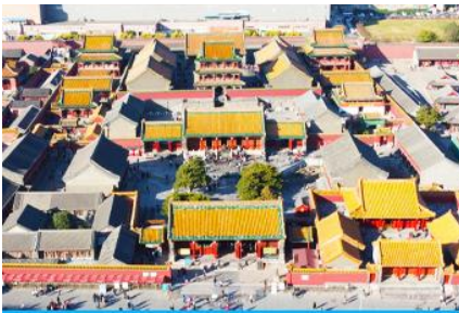
พระราชวังโบราณเสียนหยาง

รับประทานอาหารเช้า ณ ห้องอาหารของโรงแรม (4)