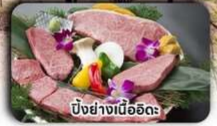
บิงย่างเนื้ออิดะ