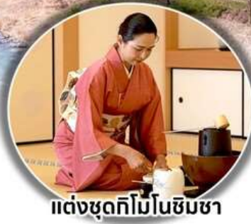
แต่งชุดกิโมโนชิมชา