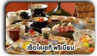
เซตโคเชกิ พรีเมียม