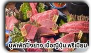
บุฟเฟ่ต์บิงย่าง เนื้อญี่ปุ่น พรีเมียม