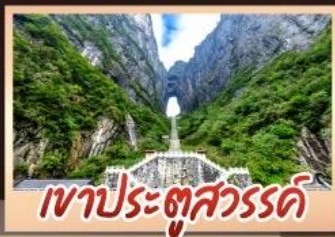
เขาประตูลัวร์