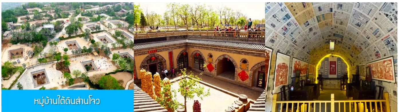
หมู่บ้านใต้ดินสามโจว

หลังอาหารนำท่านเดินทางสู่ เมืองซานเหมินเกีย 三门峡 (ระยะทาง 149 กม ใช้เวลาเดินทางราว 2 ชั่วโมง)