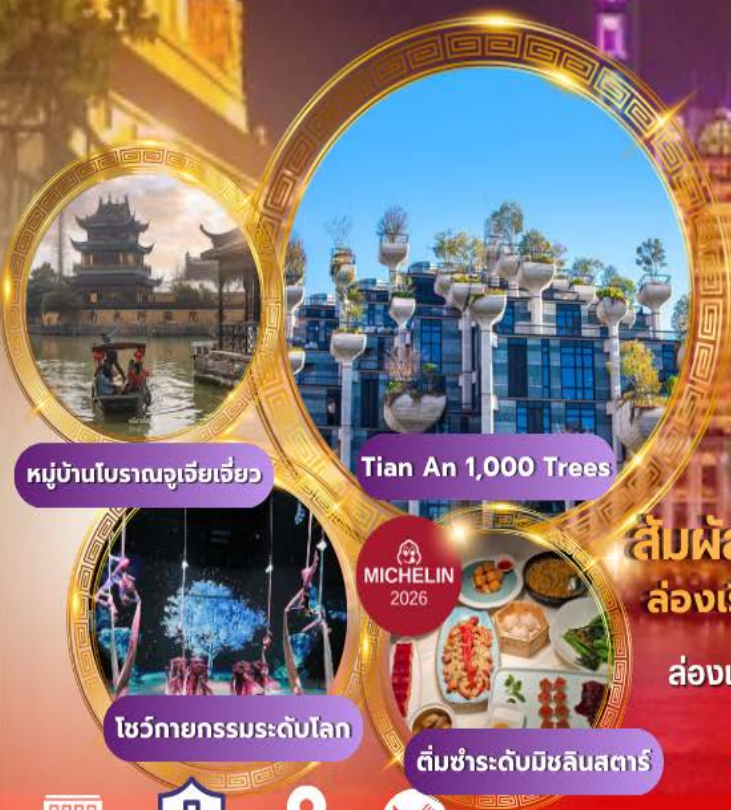
หมู่บ้านโบราณจูเจียเจี้ยว

บินหรู Full service พัก 5 ดาวย่านช้อปปิ้ง