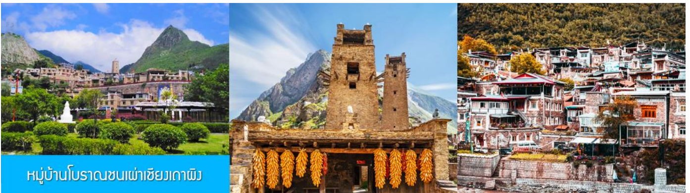
หมู่บ้านโบราณชนเผ่าเซียงเถาผิง