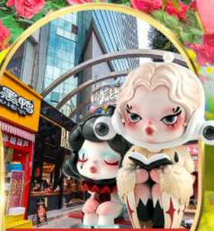
POP MART ถนนคนเดินหนานผิงเจีย