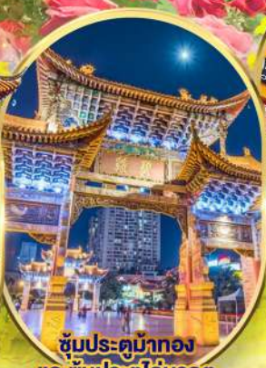
ชมประติมากรรม และ ชมประตูโถงมรกต