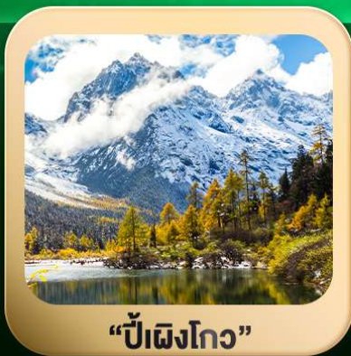
“ปี่ฝิงโกว”

ชมธรรมชาติ 2 อุทยานขึ้นชื่อ อุทยานภูเขาสี่ครุณี + อุทยานปี่ฝิงโกว สะพานหนานเฉียว • ถนนคนเดินไท่กู่หลี่ + ซุนซีลู่ + Pop Mart • ดงเจียวจื่อ