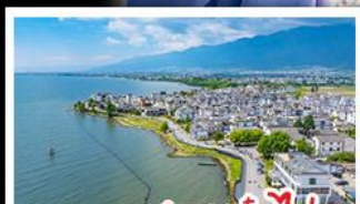
ทะเลสาบเอ๋อไห่