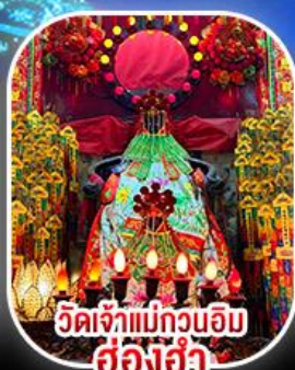
วัดเจ้าแม่กวนอิม ฮ่องฮำ