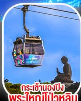
กระเช้าเองปีง พระใหญ่โป่วหลิน