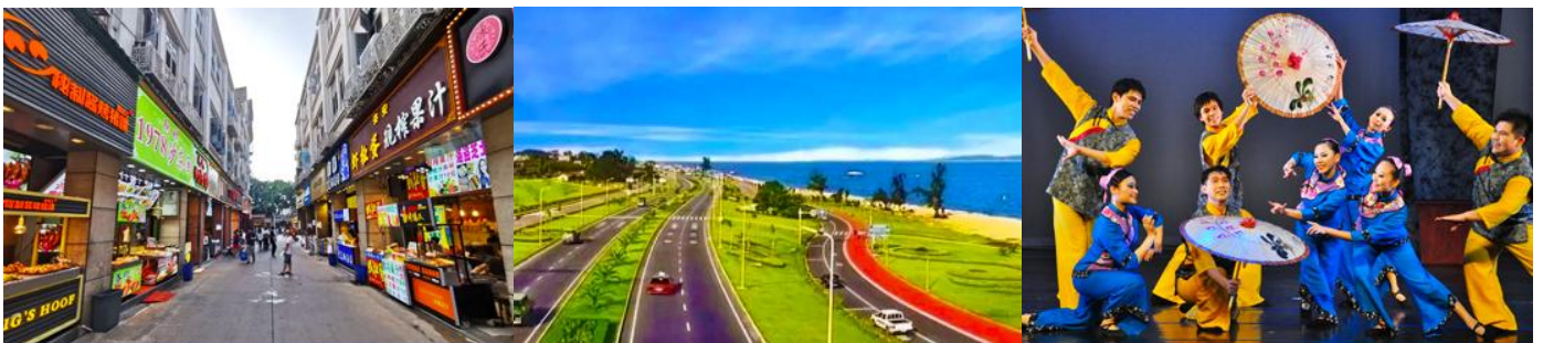
ถนนวซาลู่

พักที่ โรงแรม XIAMEN HENGLONG HOTEL 4* หรือเทียบเท่าในเมืองเซี่ยเหมิน