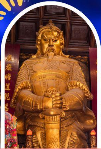
วัดแซกง ขอพรโชคกลาง การเงิน และธุรกิจ