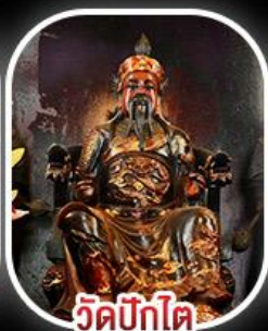
วัดบิกิต