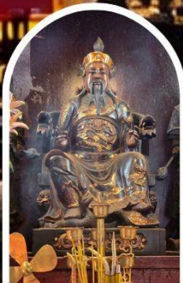
วัดปักไต้ เสริมโชคกลางนำความรุ่งเรืองทุกด้านของชีวิต