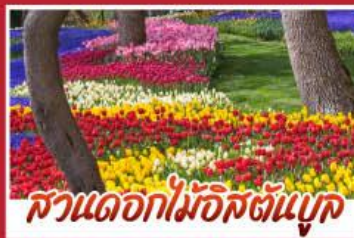
สวนดอกไม้อักษะตันบูค