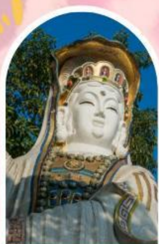
ริพลัสเบย์ รับพลังงานดี เสริมพลังดวงจัญ