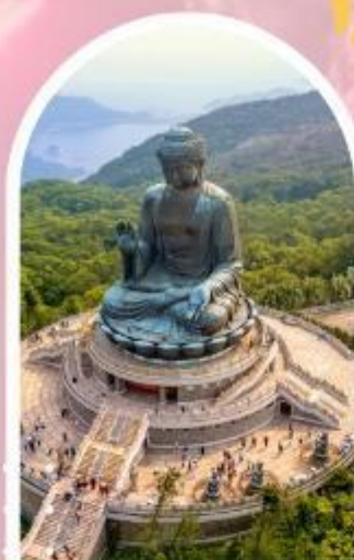
นั่งกระเช้านองปิง นมัสการพระใหญ่ไป่หวลัน