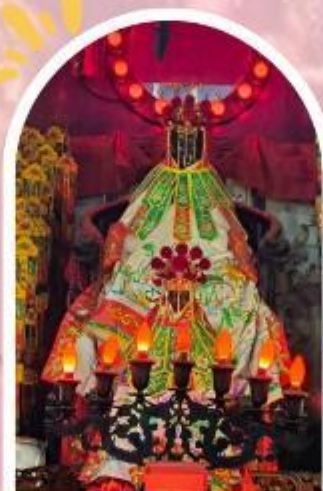
วัดเจ้าแม่กวนอิมอ่องฮำ ขอพรเรื่องเงิน ทรัพย์สิน และความมั่งคั่ง