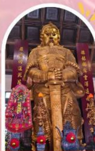
วัดแซกกง ขอพรโชคกลาง การเงิน และธุรกิจ