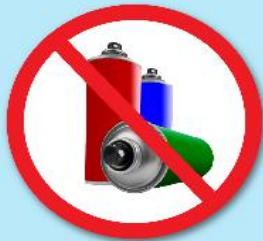
ขวดสเปรย์