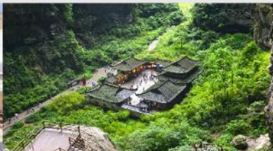
อุทยานแห่งชาติบ่อหลุมฟ้า

*ทางบริษัทฯ ขอสงวนสิทธิ์ในการสลับโปรแกรมทัวร์ตามความเหมาะสมขึ้นอยู่กับสถานการณ์หน้างาน โดยคำนึงถึงผลประโยชน์ของลูกค้าเป็นสำคัญ