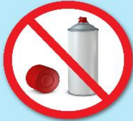
กระป๋องสเปรย์