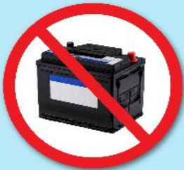
แบตเตอรี่ดำ