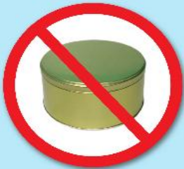
กล่องโลหะ