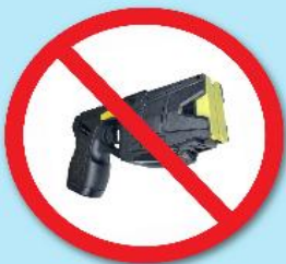
ปืนช็อตไฟฟ้า